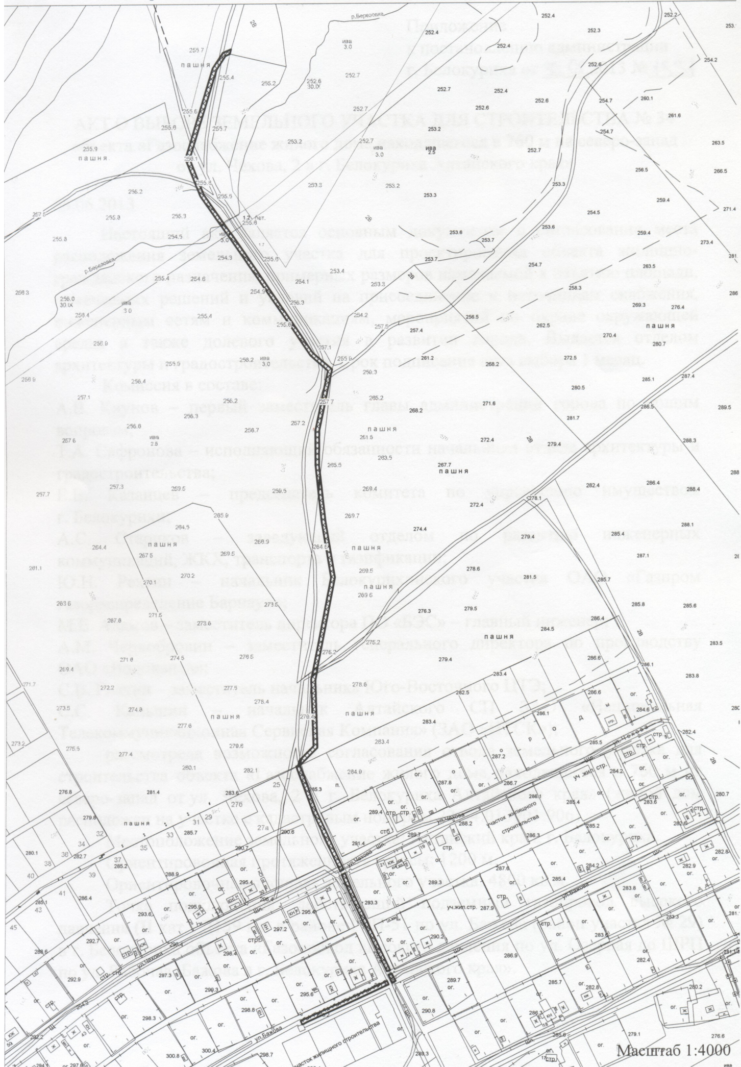
Схема размещения газопровода высокого давления по ул. Бажова, ул. Нижняя