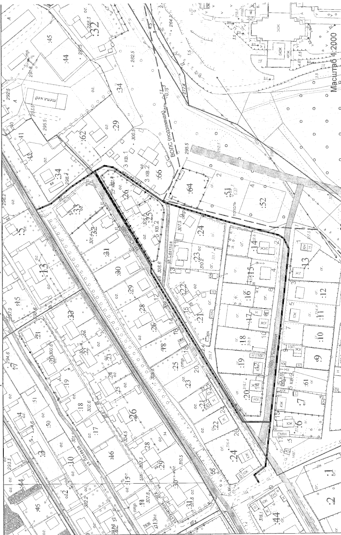
Схема размещения газопровода по ул. Светлая, ул. 60 лет Победы, пер. Рыбацкий